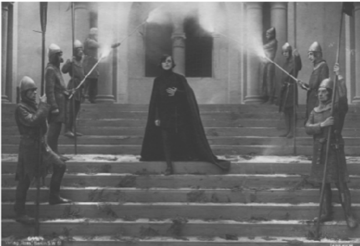
« Asta Nielsen : Hamlet descend les escaliers à Elsenœur » Hamlet , Allemagne, 1920