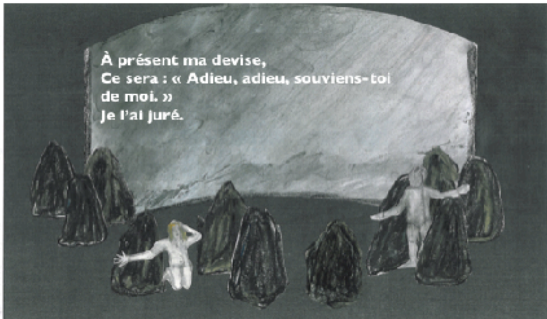
Croquis scénographique avec projection de la traduction

En fond de scène, sur un écran tendu sur un ou deux portants (en fonction des salles) concaves ou convexes de 3m de large, de 2,50m de hauteur pour l'un et de 2,90m pour l'autre. La traduction des monologues d'Hamlet sera projetée sur le décor lui-même, lorsqu'ils seront interprétés en anglais, le reste du texte restant en français.