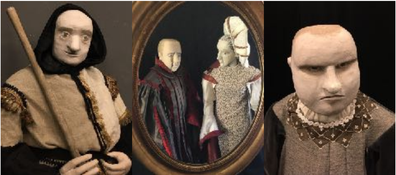
Le Fossoyeur - Le Roi Claudius - La Reine Gertrude - Rosencrantz

Trois marionnettes de petite taille, comme des jouets d'enfance, joueront dans un castelet la scène dite de « la souricière ».