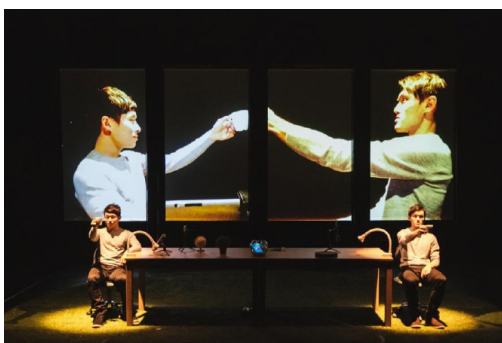
Very Theater, Tea time with me myself and I

Aujourd'hui, la manipulation de l'image est largement présente dans le travail des marionnettistes. L'image et la vidéo sont considérées comme matière brute à part entière. La projection et la transformation en direct d'images, de vidéos, de l'acteur, via des caméras et des rétro/vidéo projecteurs, sont utilisés par l'artiste pour faire sens.