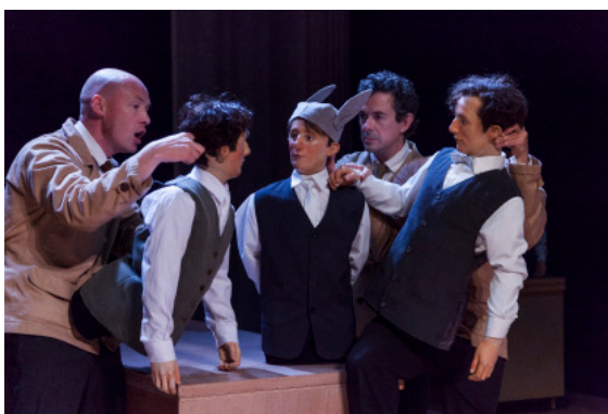
Compagnie Trois Six Trente, L'Institut Benjamenta

L'hyper-réalisme est caractérisé par une représentation poussée à l'extrême du visible. Tout chez ces marionnettes rappelle l'être humain : leur physionomie, leurs cheveux, ainsi que leurs vêtements ou accessoires. La présence de ces marionnettes peut être troublante puisqu'elles figurent toute la réalité de la vie sans être vivantes. En côtoyant sur le plateau le corps de l'acteur, elle induit une autre présence scénique.