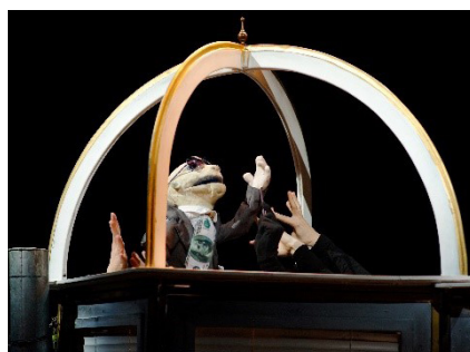
Compagnie La Controverse, Les Maîtres du monde

La muppet est une marionnette en mousse avec une bouche articulée. Elle est célèbre grâce au « Muppet Show ». Aujourd'hui on peut la voir dans le travail de Neville Tranter ou dans les mains de Jeff Panacloc. Le manipulateur enfile sa main dans la marionnette et fait bouger la bouche grâce à un mouvement de pince.