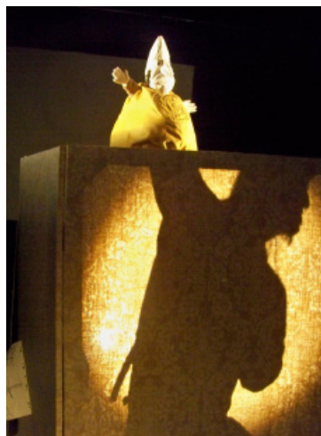
Compagnie Zouak, Jaja

La gaine est aussi une tradition chinoise, où elle possède des pieds et jambes en bois en plus. Aujourd'hui, de nombreuses compagnies réutilisent et réinventent cette technique, le marionnettiste peut apparaître aux côtés de sa marionnette.