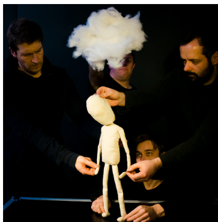
Hijinx & Blind Summit, Meet Fred

Grande marionnette issue de la tradition japonaise, elle se manipule traditionnellement par trois comédiens habillés tout en noir. Aujourd'hui elle peut avoir toute forme, toute taille, pour être catégorisée en tant que marionnette Bunraku, si tôt qu'elle est maniée par deux, trois voir quatre manipulateurs. De cette technique, c'est également développé la marionnette portée. Elle peut intégrer les bras et/ou les jambes du marionnettiste, unis dans un même costume. La marionnette portée, comme le bunraku, engage tout le corps du manipulateur.