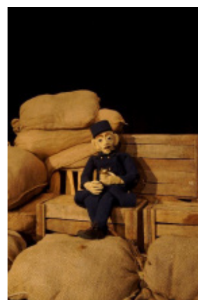
Compagnie des Singes hurleurs, Le Soldat Antoine

D'une grande liberté de mouvement, elle permet de saisir les réalités de notre société.