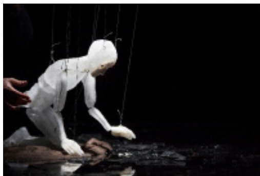
Théâtre de l'Entrouvert, Anywhere

La marionnette est manipulée par le dessus, grâce à des fils reliés aux articulations. Toutes les parties mobiles du corps sont actionnées par des fils attachés à un instrument appelé croix ou contrôle que le marionnettiste manipule pour mouvoir la marionnette. La manipulation rend les mouvements de ces marionnettes très réalistes. Elle est cependant complexe et demande une grande maîtrise de la part du marionnettiste.