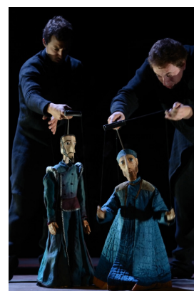
Arketal, Conte d'hiver

Ces marionnettes sont équipées d'une tige rigide en fer fixée au niveau de la tête, la manipulation se fait par le dessus. La marionnette à tringle est lourde, les membres peuvent bouger par simple inertie. Les bras et les jambes peuvent également être actionnés par de plus petites tiges et/ou par des fils. Les plus connues sont les pupi siciliens. Le plus souvent manipulée par le haut et par derrière, elle peut aussi être manipulée par le bas.