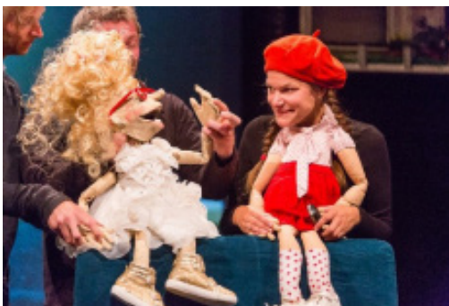
Théâtre des 4 mains et Théâtre Froe Froe, Poupette in Bruxelles

Ce procédé consiste à poser une (vraie) tête d'acteur sur un corps minuscule de marionnette dont les bras et les jambes paraissent animés d'une vie autonome. Le manipulateur devient comédien et fait un avec la marionnette. La technique Kokoschka joue avec les rapports de proportion, les échelles, induisant un effet comique irrésistible.