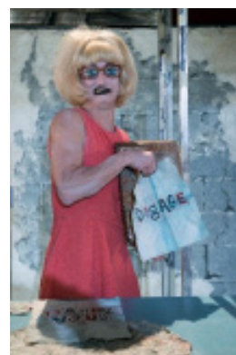
Théâtre de La Licorne, Sweet Home

Les marionnettes sont de simples objets du quotidien (vaisselle, outil, balais, jouet, vêtement, nourriture...). Le marionnettiste est comédien et manipule à découvert. Les objets peuvent être neufs, usés, même cassés ou customisés. L'objet sort de sa logique utilitaire et est utilisé pour sa force symbolique, poétique et métaphorique. Ils sont détournés, pour être considérés comme de véritable personnage théâtral et non de simples accessoires.