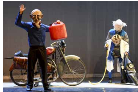
1 - Les Iréels (2015) 2 - Place des Anges, Gratte-Ciel (2019) 3 - Dondoro (1994) 4 - Turak (2019)